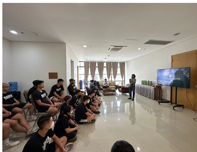
光明大學導覽介紹