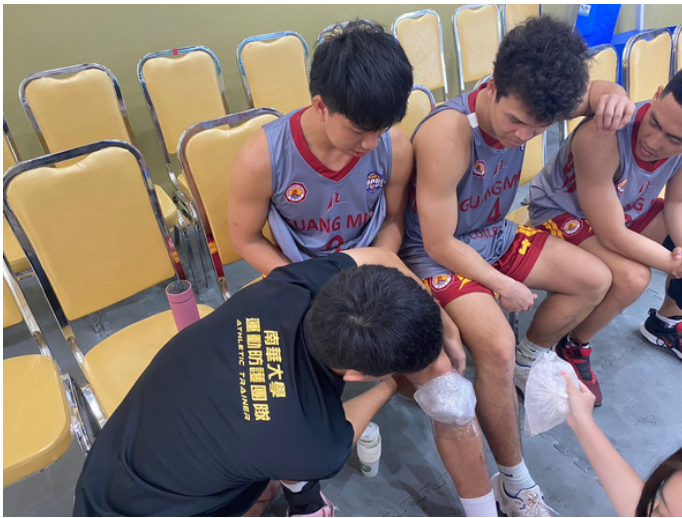
運程防護替光明男籃隊員賽後冰敷處理