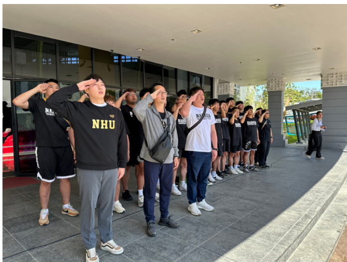
歡迎儀式的兩國升旗典禮