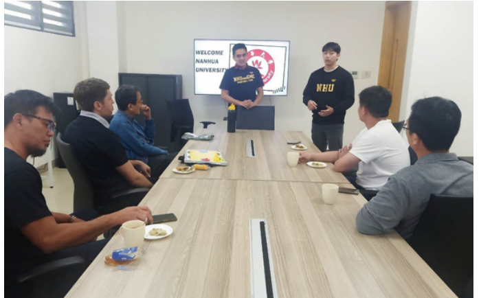
教練交流-快攻戰術介紹 by Coach Mo