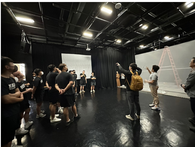
表演藝術系的專業教室black box