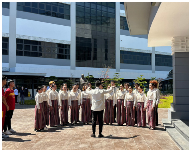
歡迎儀式的光明合唱團演唱