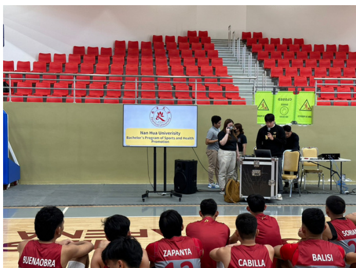
南華大學與運動學程介紹 by 杜繼超