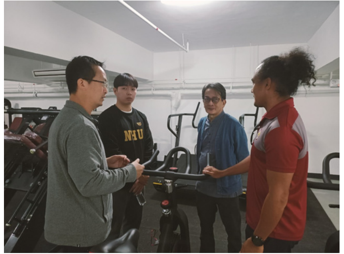
三好體育館重訓室介紹