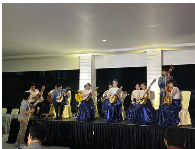
歡迎晚宴的光明傳統音樂表演